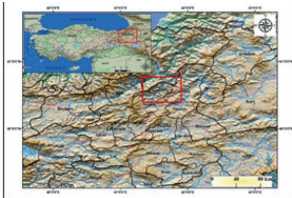
Şekil 1. Lokasyon haritası.