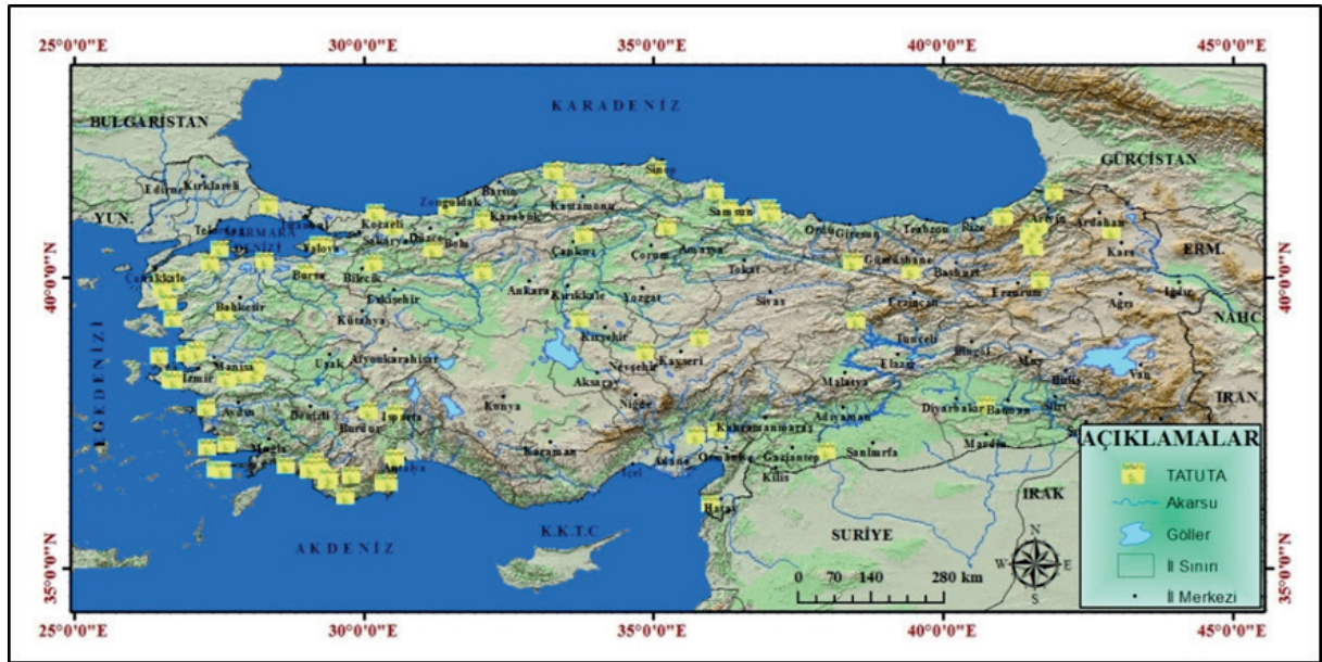
Şekil 3. Türkiye’de TaTuTa’ya üye başlıca çiftlik ve pansiyonlarının dağılışı.